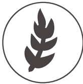
1. CEREALS CONTAINING GLUTEN*

NEXT TO THE NAME OF EACH DISH YOU WILL FIND THE NUMBERS CORRESPONDING TO EACH ALLERGENIC INGREDIENT, BASED ON THIS TABLE.