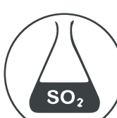
14. SULPHUR DIOXIDE (SULPHITES)